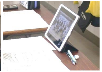
廊下に待機した代議員が意見を集約