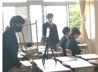
iPad で撮影して →→→ 教室に配信